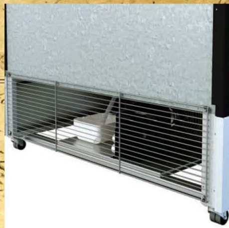
Rodas e grelha de proteção traseira Ruedas y rejilla de protección trasera Castors and back protection grid Roues et grille de protection arrière Räder und rückseitiges Schutzgitter