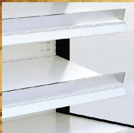
Palas em acrílico Barandillas en acrílico Plexiglas stoppers Tablettes d'arrêt en plexiglas Acryleinfassung