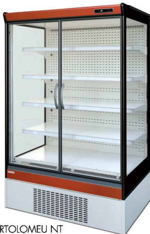
BARTOLOMEU NT RAL 2002