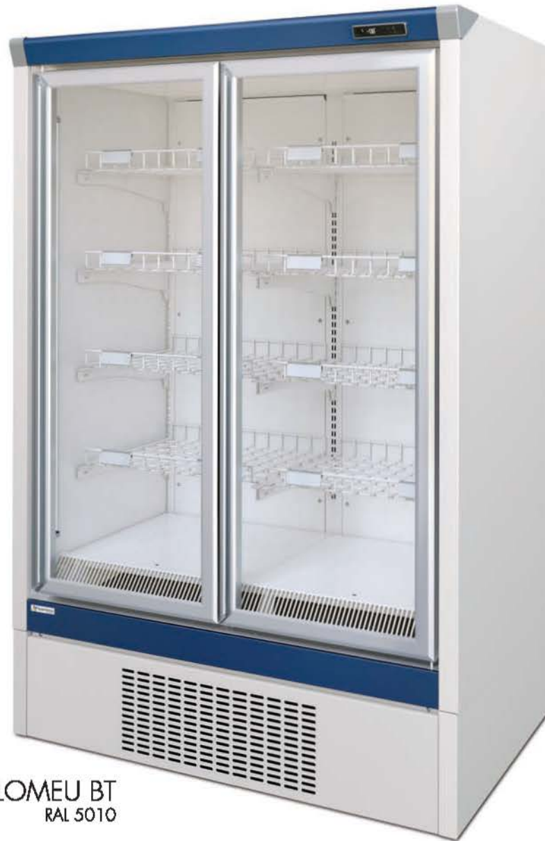
BARTOLOMEU BT RAL 5010