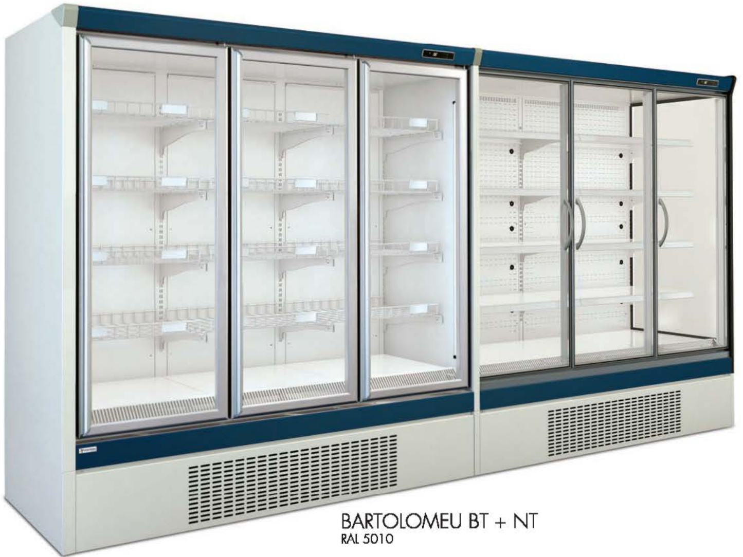
BARTOLOMEU BT + NT RAL 5010