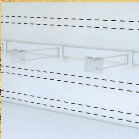
Barras de carga e ganchos Barras de suspensión y ganchos Hanging bars and hooks Barres de charge et crochets Ladestangen und -haken