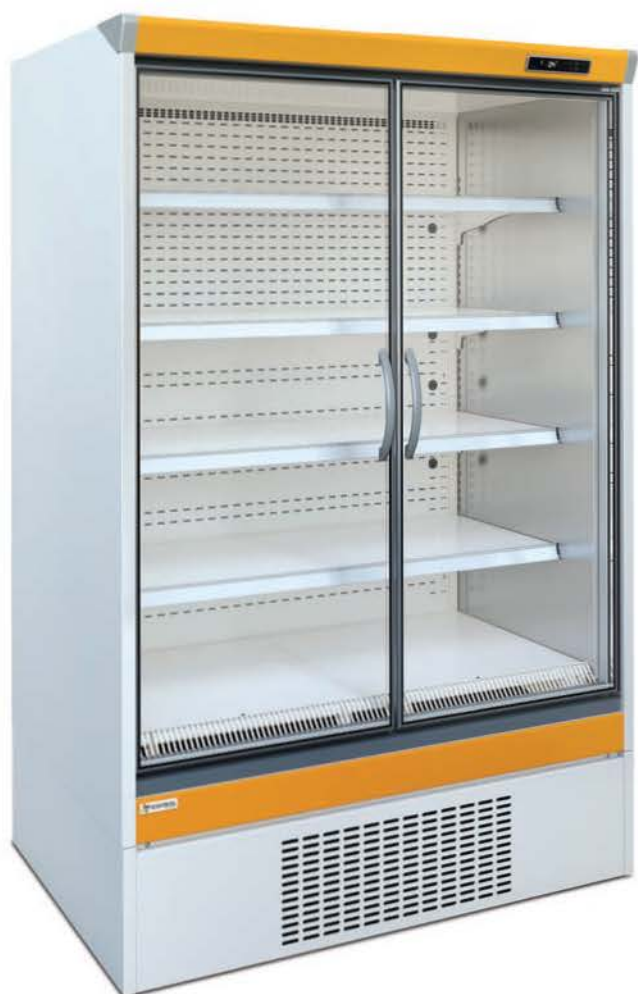
BARTOLOMEU NT RAL 1037